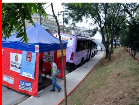
Prefeitura no Bairro - Jabaquara