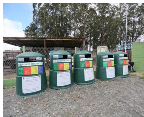
Ecoponto – Guaiaponto - Guaianases