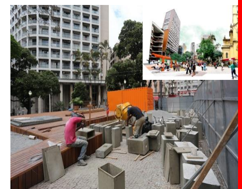
Intervenções Urbanas no Largo do Paissandu