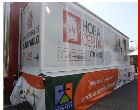
Intervenções Urbanas no Largo do Paissandu