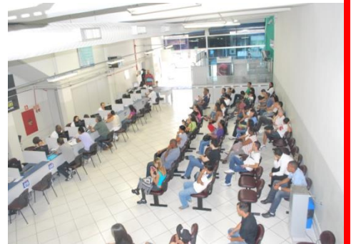
Central de Triagem – Ecoponto Paraisópolis