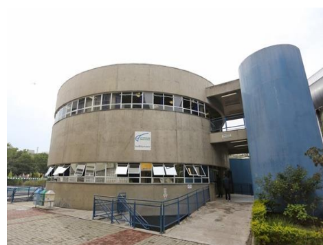
Ecoponto – Guaiaponto - Guaianases