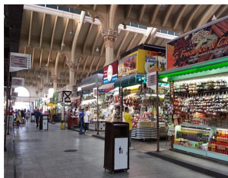
Mercado Municipal – Ponto Turístico da Cidade